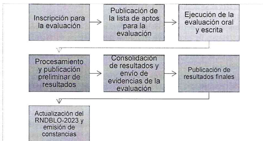
Ilustración 1: Etapas del Proceso de la EDLO-2023

La EDLO-2023 se desarrollará en las siguientes etapas: